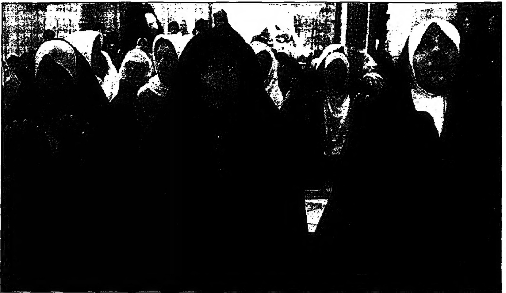
سيادة عراقيات يسلن في أحد مساجد بغداد حيث زالت اجراء المواجهة تخيم على الحياة اليومية (ديوتري)